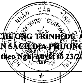
Biểu số 2